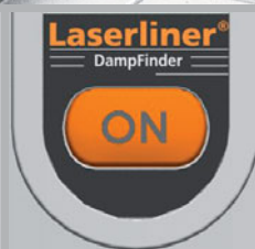
Commande facile par touches