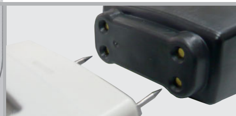
Capuchon de protection à fonction de test automatique