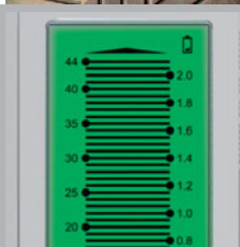
Grand afficheur bien lisible à cristaux liquides