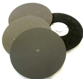
Disque de polissage avec divers papiers pour polir le bois et chapes.