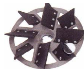
Disque pour jointure grâce aux 8 lèvres flexibles en caoutchouc bien faites, pleines, joints lisses, aussi pour plaques dis- proportionnées.