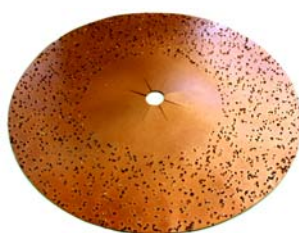
Disque de polissage Ø 400 mm avec grenailles en métal dur.