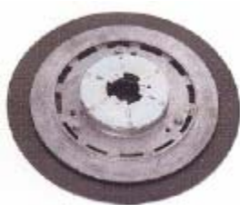
Disque pour talocher (lisser) Ø 480 + 560 mm pour ciment et chape.