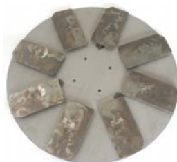
Disque Ø 600 mm avec 8 pâles pour lisser de petites surfaces en béton.