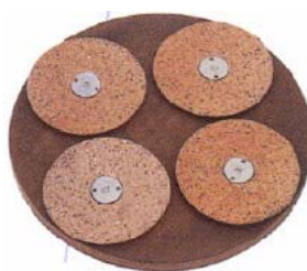
Plateau de polissage avec 4 disques en métal dur pour poncer céramique, époxy et résidu de mortier.