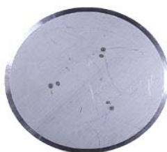
Disque de remplacement Ø 480 + 560 mm seul, le disque en tôle d'acier de 4 mm d'épaisseur peut être remplacé en cas d'usure.