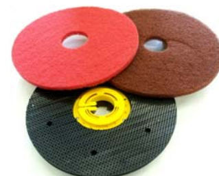
Plateau d'entraînement plastique pour Pads pour nettoyer les éléments de coffrage, et...