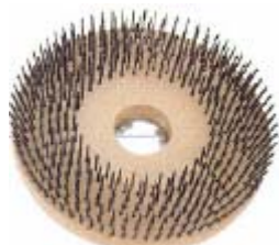
Brosse métallique-fils plats pour débourber des surfaces de ciment, enlever du plâtre ou déchets de tapis.