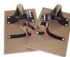
Sabot pour chapeur.