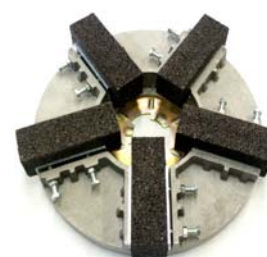
Disque de polissage pour pierre pour surfaces irrégulières sur ciment et divers sols.