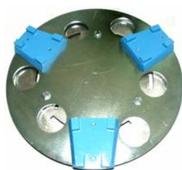
Disque de polissage avec diamants pour polir des surfaces en pierre et béton.