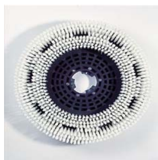
Brosse de Nylon en poils durs, pour nettoyer.