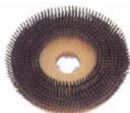
Brosse métallique-fils ronds pour nettoyer des planches de coffrages brutes ou enlever des résidus de plâtres.