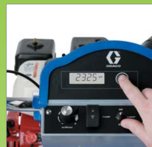
Modulateur Pro City

●● : option conseillée avec une traction Citadrive