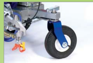
Roue avant tournante