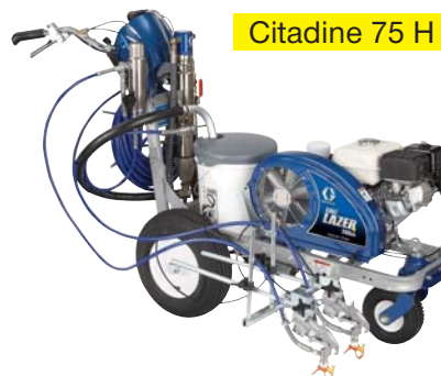
Citadine 75 H