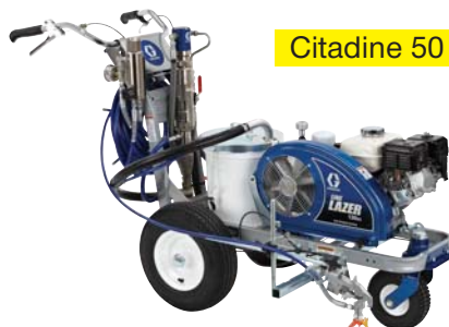
Citadine 50 H